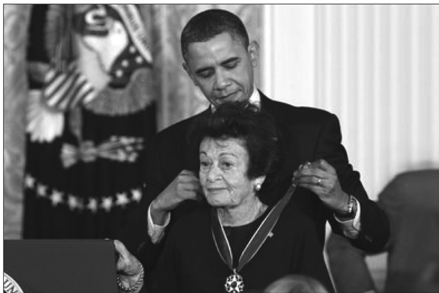
Prezident Barak Obama předává Medaili svobody Gerdě Weissmannové Kleinové.